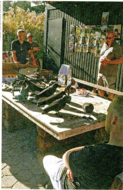
Wichtig für eine erfolgreiche Krähenjagd ist das richtige Equipment.